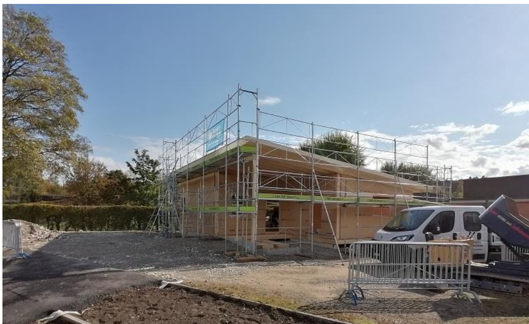
Der neue Jugendraum bei der Badi nimmt Gestalt an