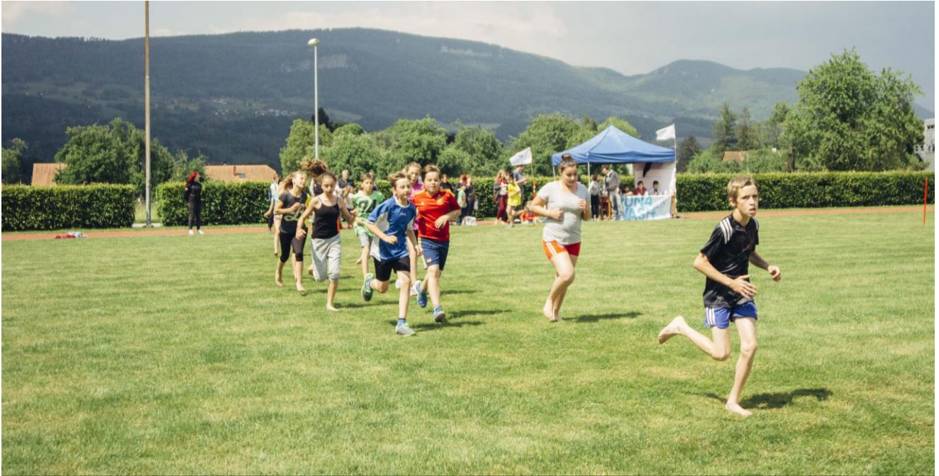
"Run4WASH": Rennen für W asser, S anitäre Anlagen und H ygiene